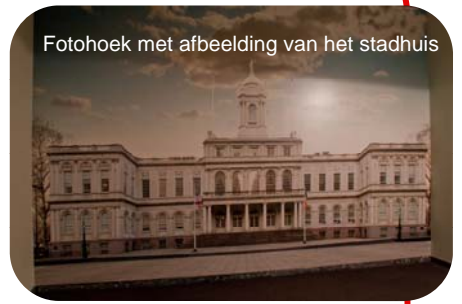
Fotohoek met afbeelding van het stadhuis

heel graag wilde ontmoeten. Hij voltrekt de meeste huwelijken in het NYMB. En je kan je geen voorstelling maken van HOEveel, tot je een half uurtje mee kijkt. Ongelofelijk. In dat half uurtje werden 11 huwelijken voltrokken!! Er waren 2 kamertjes. Die noemen ze de Wedding Chapels. Ontworpen door de persoonlijke designer van de Burgemeester, en daar zijn ze echt trots op. De ambtenaar gaat 1 kamer in met een bruidspaar, controleert de namen (kijkt niet naar een id-bewijs, dat is aan de balie al gedaan), vraagt of ze ringen gaan wisselen en start. Stelt alleen de vraag, die eigenlijk dubbel is. "Neem je aan tot je echtgenoot" is vraag 1 en dan volgt vraag 2 "beloof je [naam] lief te hebben, te eren, te koesteren en van haar te houden tot de dood jullie scheidt?" En slotte bevestigt de ambtenaar dat ze getrouwd zijn en krijgen ze een huwelijkscertificaat. Dat is het. Ze noemen het de "New York minute", maar in werkelijkheid zijn het er 2. De meeste tijd zit in de kennismaking en positioneren in de kamer. Op de website is een filmpje terug te vinden. Net zoals de tekst die ze gebruiken.