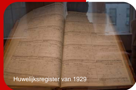
Huwelijksregister van 1929