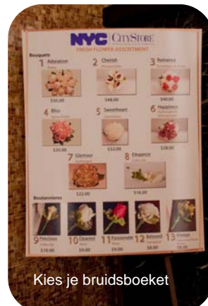
Kies je bruidsboeket